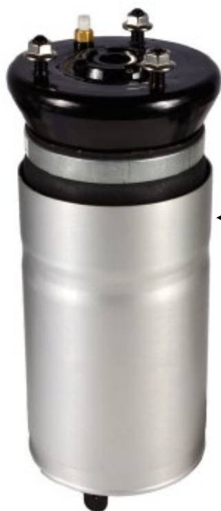
5. 1x Module de ressort pneumatique